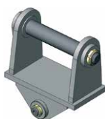
Excavator link Staffa basculante per escavatore